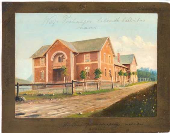
Vecpiebalgas labdarības biedrības nams. Gleznojis Jānis Krēslis. 19. gs. beigas. Latvijas Nacionālā vēstures muzeja krājums

Izstādē eksponēja mākslinieka Jāņa Staņislava Rozes gleznotos Rīgas Latviešu biedrības vadītāju portretus, biedrības publicētos izdevumus, kā arī statistiku par visām pārējām aptuveni 600 tolaik pastāvošajām latviešu biedrībām, to ģeogrāfisko sadalījumu pa apriņķiem, darbības sfērām un finanšu uzkrājumiem. Tāpat tika eksponēti dažādu biedrību karogi, nozīmes, apbalvojumi, biedrību namu zīmējumi un fotogrāfijas, tādējādi pasvītrot latviešu sabiedriskās dzīves masveida raksturu un formu daudzveidību.