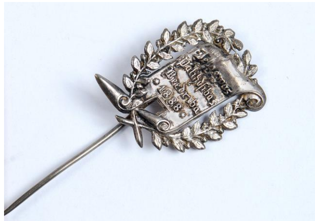
Jelgavas palīdzības biedrības nozīme. 1888. gads. Latvijas Nacionālā vēstures muzeja krājums