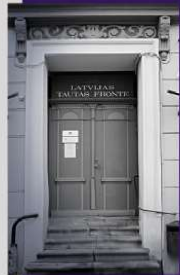
LNVM nodaļa TAUTAS FRONTES MUZEJS Vecpilsētas iela 13/15, Rīga LV-1050 tālrunis: 67224502, e-pasts: tfm@lnvm.lv