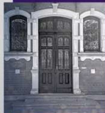
LNVM nodaļa “DAUDERI” Zāģeru iela 7, Rīga LV-1005 tālrunis: 67391780 e-pasts: dauderi@lnvm.lv