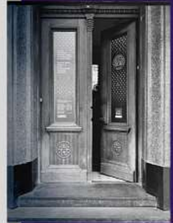
LNVM pamatekspozīcija un izstāžu zāles Brīvības bulvāris 32, Rīga LV-1050 tālrunis: 67221357, e-pasts: info@lnvm.lv