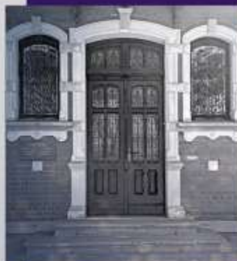
LNVM nodaļa “DAUDERI” Zāgeru iela 7, Rīga LV-1005 tālrunis: 67391780 e-pasts: dauderi@lnvm.lv