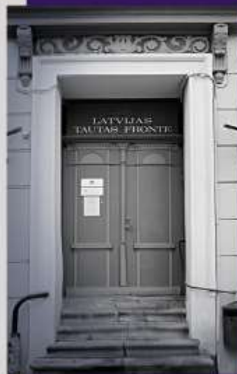
LNVM nodaļa TAUTAS FRONTES MUZEJS Vecpilsētas iela 13/15, Rīga LV-1050 tālrunis: 67224502, e-pasts: tfm@lnvm.lv