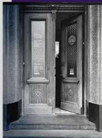
LNVM pamatekspozīcija un izstāžu zāles Brīvības bulvāris 32, Rīga LV-1050 tālrunis: 67221357, e-pasts: info@lnvm.lv