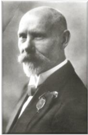
Pirmais Valsts prezidents Jānis Čakste