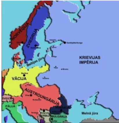
Eiropa pirms Pirmā pasaules kara

1. Aplūko šīs kartes ekspozīcijā! Kas mainījās pēc Pirmā pasaules kara?