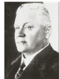
Valsts prezidents Kārlis Ulmanis (amatā iecelts ar paša rīkojumu)