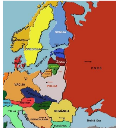
Eiropa pēc Pirmā pasaules kara