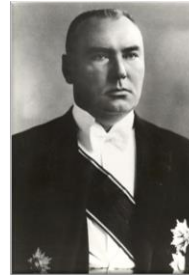
Trešais Valsts prezidents Alberts Kviesis