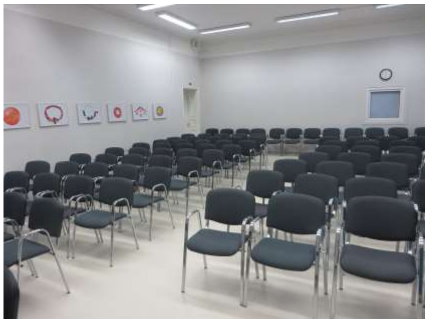
Attēlā: LNVM Konferenču zālē.

15.50 – Diskusijas. Konferences noslēgums.