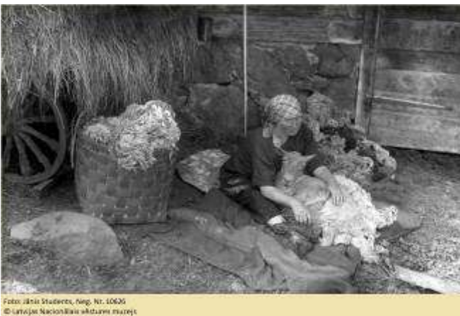
neg. Nr. 10626

Ceļojošā izstāde jau pabijusi Latvijas mācību iestādēs, iepazīstinot skolēnus ar Pieminekļu valdes veikumu, un arī turpmāk tā būs pieejama eksponēšanai skolās un sabiedriskās vietās.