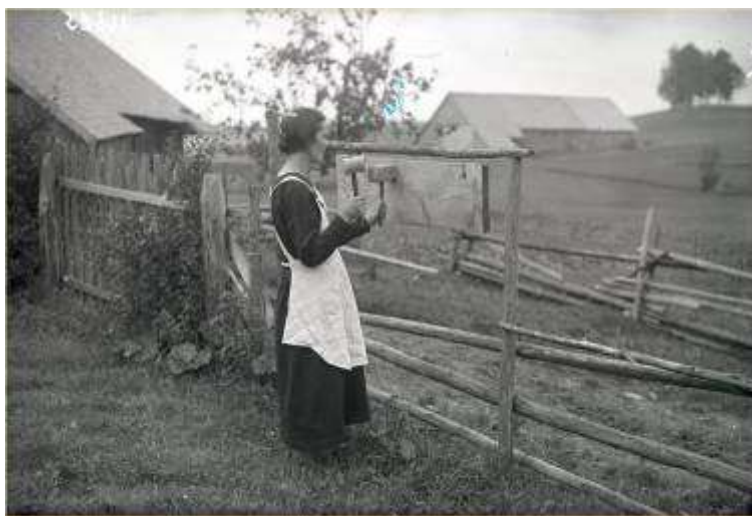
Reg. Nr. 10667