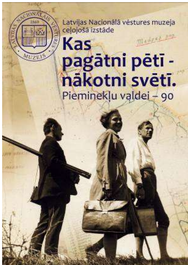
Izstādes reklāmas plakāts.

vieta: Jūrmalas profesionālā vidusskola | laiks: 10.-11. oktobris.