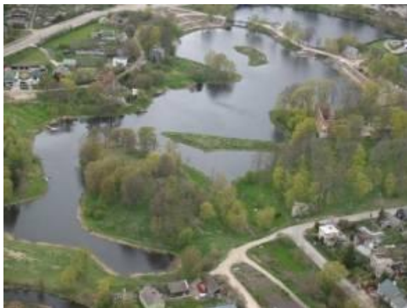
Atēlā: Grobiņas pilskalns.

Atklāta tīmekļa vietne www.vikingheritage.org , kur var iepazīt jaunās Pasaules mantojuma nominācijas par vikingu laiku. Uz Pasaules mantojuma sarakstu pretendē arī Latvijas Grobiņas senkapi un apmetnes.