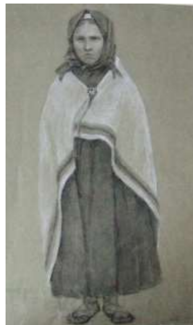
Attēlos: Latviešu tipi no Ādama Alkšņa kolekcijas LNVM krājumā.

Zīmējumi darināti ogles tehnikā, reizēm izgaismoto laukumu akcentēšanai izmantots krīts.